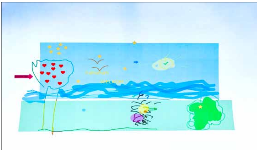
Afbeelding 1: Whiteboard groepstekening.

De aangeboden vaktherapeutische werkvormen kunnen zeer divers zijn. Hieronder een kleine greep uit de mogelijk-