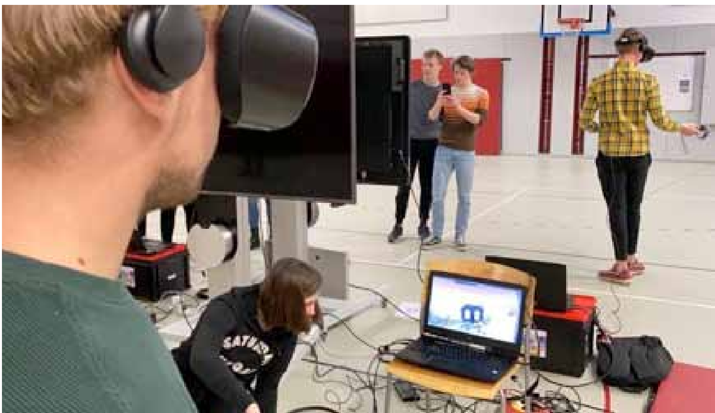
Afbeelding 5: Studenten psychomotorische therapie aan de HAN leren technologie integreren in de therapie.

De meeste vormen van telepresentie geven via een beeldscherm een kijkje in de wereld van de ander of de gezamenlijk gemaakte wereld. VR geeft het gevoel fysiek daadwerkelijk in de virtuele ruimte te zijn. Door een VR-bril op te zetten en vrij te kunnen bewegen kan men elkaar ontmoeten in een virtuele ruimte waar men elkaar kan zien en horen. Hierin kan men zich samen verplaatsen en tot spel komen zoals in het echte leven. Hierbij wordt vooral het limbische deel van de hersenen geactiveerd, het gedeelte dat betrokken is bij emotie, motivatie, genot en het emo-