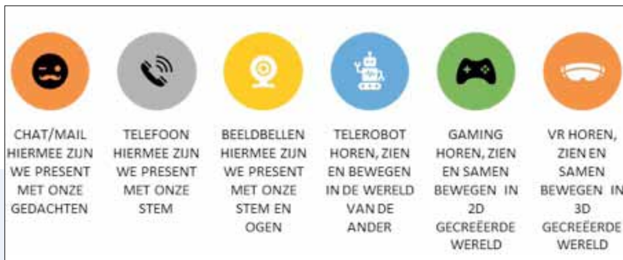
Figuur 1: Telepresentie-tools.

De vraag die eerder in dit artikel aan de orde kwam: “Online vaktherapie, kan dat wel?” valt dus te beantwoorden: “Ja, het kan” Er kan via online werken wel degelijk contact gemaakt worden. Er kan gewerkt worden met beweging, vormgeving en spel. Tijdens de coronacrisis bood het online werken een oplossing voor het niet op